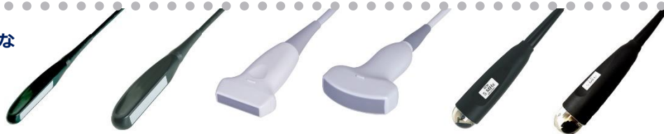
LB760S LB760V リニアレクタ 5/7.5/10MHz